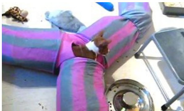
Valparna tränar balanssinnen med klättring och rullar inne i kattunneln. Det minskar åksjuka.