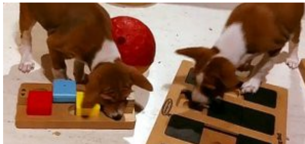
Valparna tränar med mentalsakerna