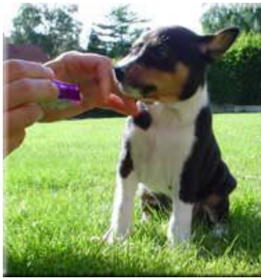
Valparna tränas för att få bättre ögonkontakt