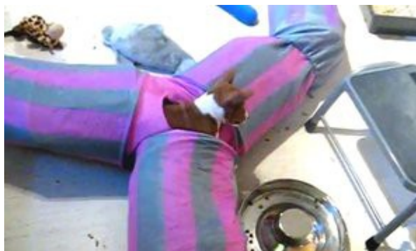
Valparna tränar balanssinnen med klättring och rullar inne i kattunneln. Det minskar åksjuka.