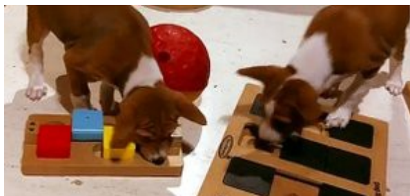
Valparna tränar med mentalsakerna